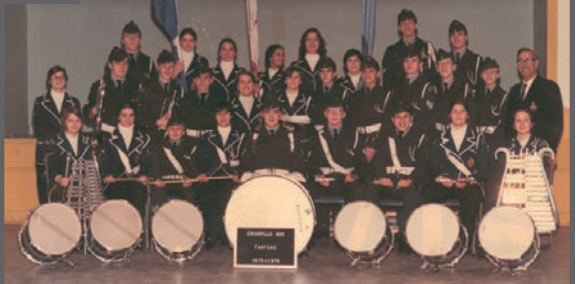
La fanfare de l'Escadrille 629 en 1975-1976