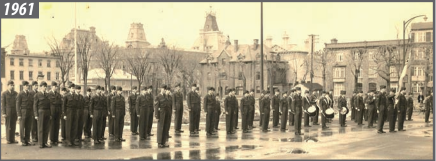
En préparation pour la parade d'église devant le Manège militaire