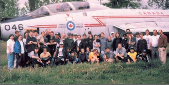
Voyage de fin d'année à Toronto, les cadets à Trenton