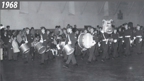
Parade annuelle de l'Escadrille 629