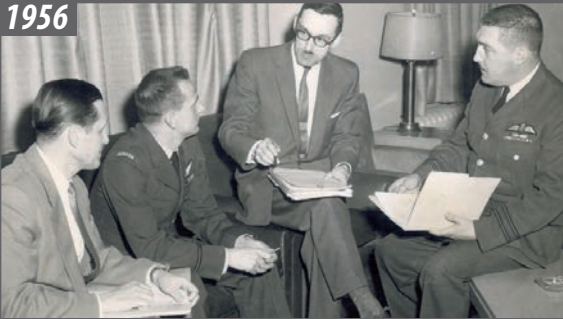
Les fondateurs de l'Escadrille 629