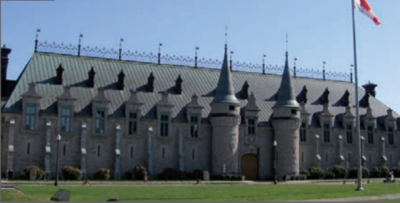
Le Manège militaire avant l'incendie de 2008