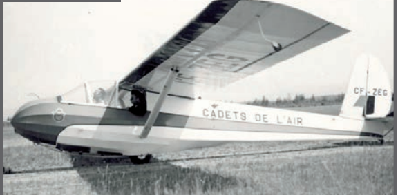
Les débuts du vol à voile du programme des cadets