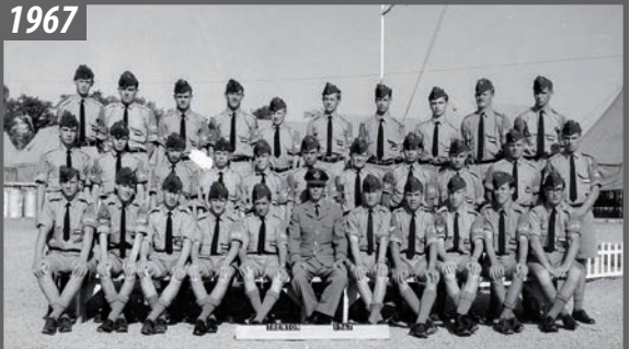
Cours de sous-officier à Trenton