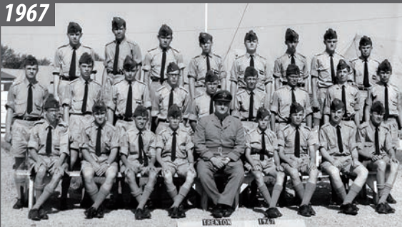
Camp d'été des cadets de l'Escadrille 629 à Trenton