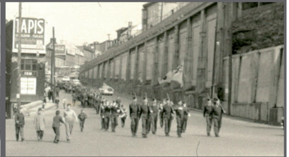
Les cadets en parade d'église sur la côte d'Abraham