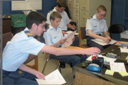
Commandant d'un soir...