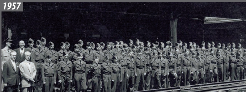
Départ pour le camp d'été de tous les cadets