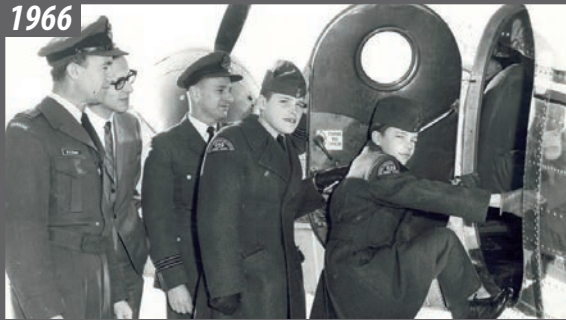
Vol de familiarisation en Beechcraft Expeditor de l'ARC