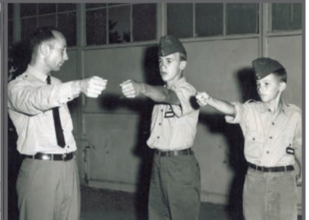
Cours d'exercice militaire