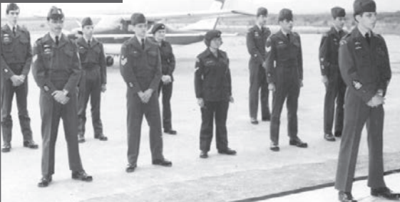
Parade de remise d'ailes, bourse de pilote d'avion