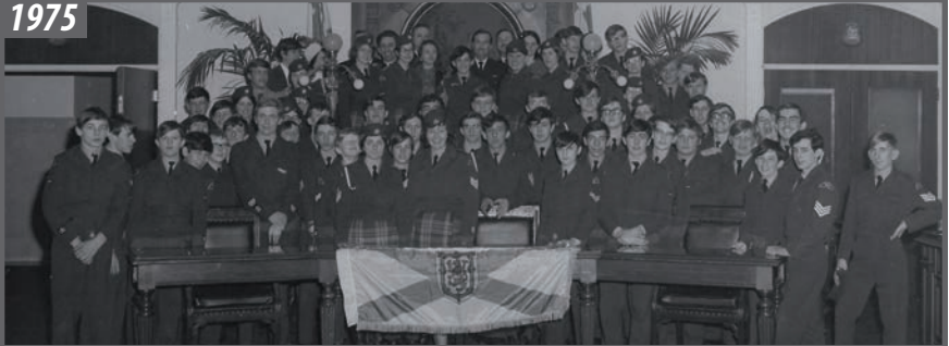
Échange avec l'Escadrille 562 Cabot de Sydney, en Nouvelle-Écosse