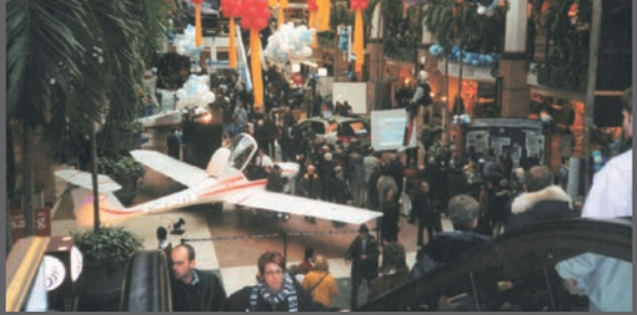
Salon de l'Aviation à Place Laurier