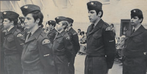
Les cadets à la parade annuelle de 1974