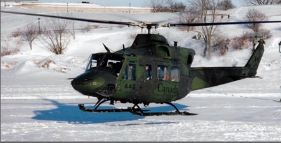
Départ en Griffon pour Hôtel de la survie, lac Sargent