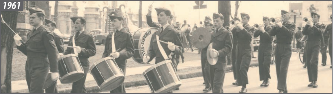
Les cadets en parade d'église sur la Grande-Allée