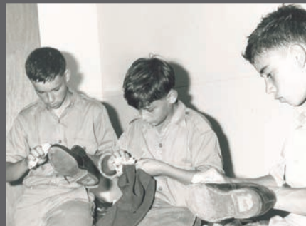
Session de cirage de bottes