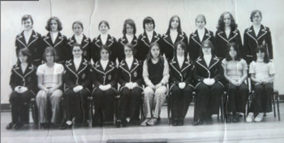
Les premières filles dans l'Escadrille 629