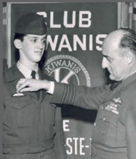
Remise d'ailes de pilote