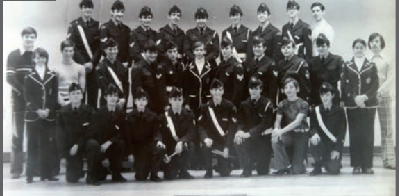
La fanfare de l'Escadrille 629 en 1973