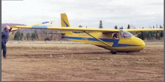
Session automnale de planeur à BFC Valcartier