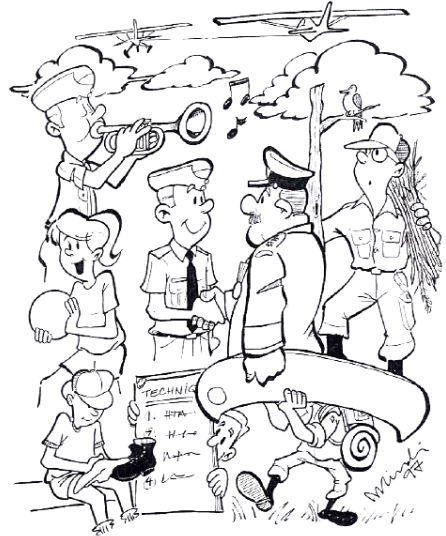
ILLUSTRATION CAPITAINE SIMON MINAKI

Elle fait partie intégrante de la majorité des activités proposées. Que ce soit par l'exercice militaire, les compétitions sportives, l'évaluation de la condition physique, randonnées pédestres ou toutes autres activités.